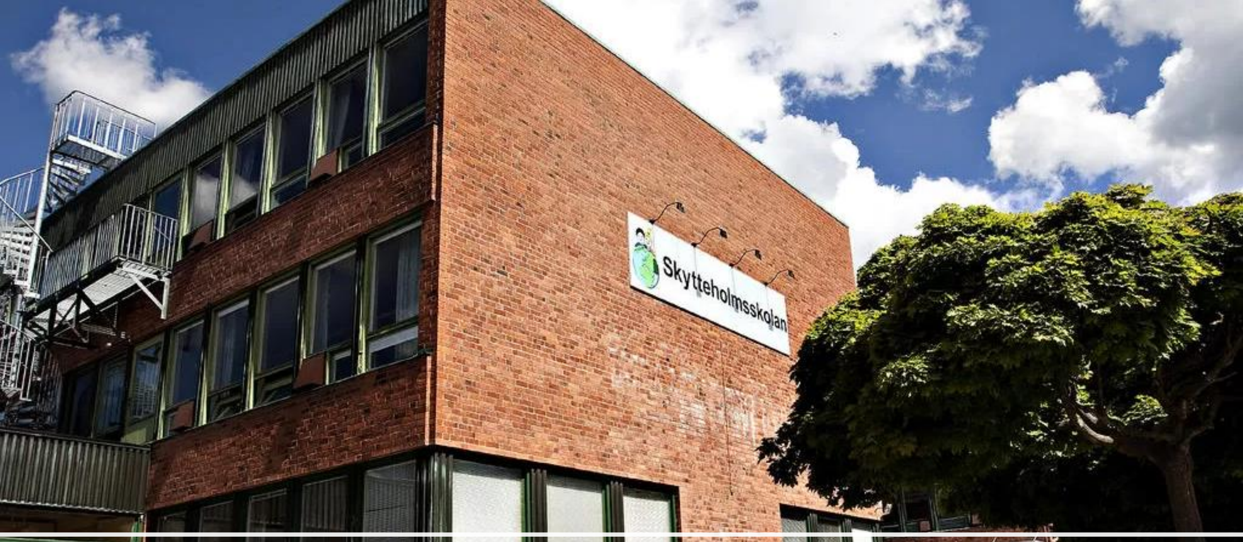
Gebäudeteil der Förderschule